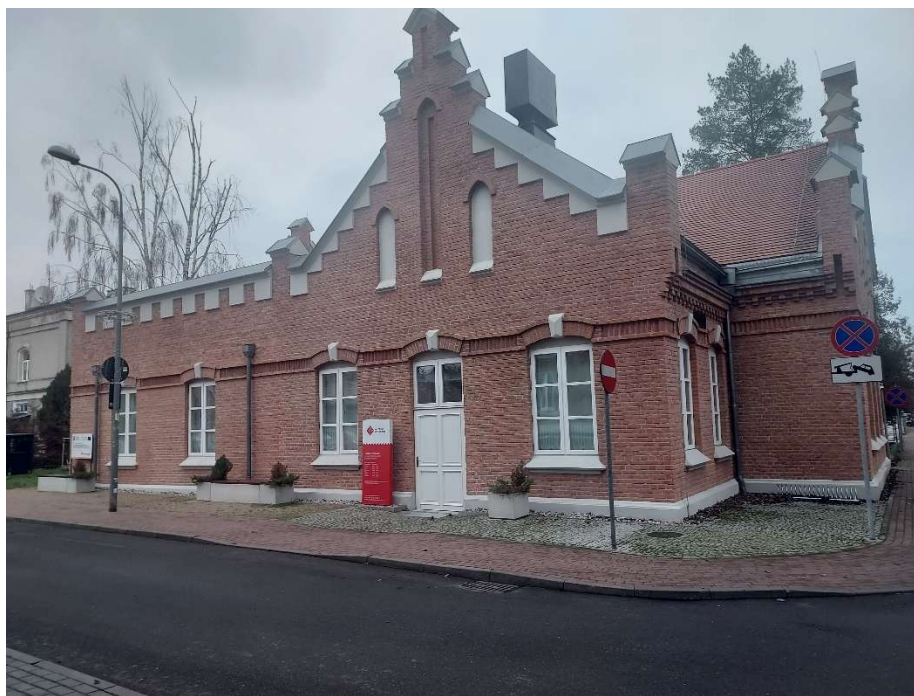
Rycina 5. Muzeum Wycinanki Polskiej

W latach 2016-2025 Gmina Konstancin-Jeziorna przeprowadziła wiele prac związanych z rewitalizacją obiektów zabytkowych, m.in. przy budynku położnym przy ul. Moniuszki 22B, willi „Gryf”, willi „Kamilin” oraz budynku dawnego Domu Ludowego przy ul. Anny Walentynowicz 18 na cele Muzeum Wycinanki Polskiej.