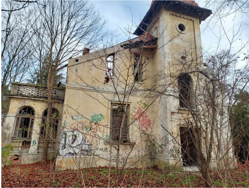
Rycina 4. Willa „Jezioranka”