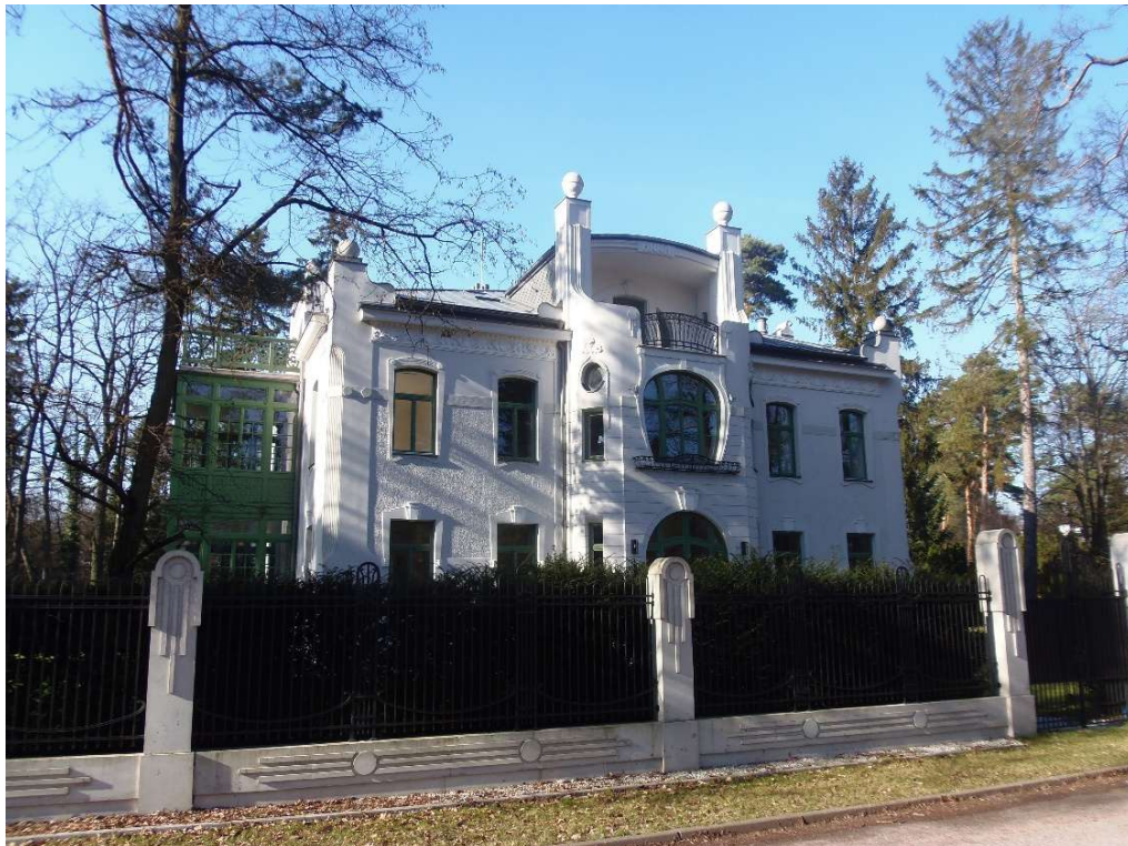
Rycina 2. Willa „Anna”

Reprezentowane też były najnowsze, najbardziej awangardowe kierunki architektoniczne: modernizm i funkcjonalizm (willa doktora Nelkena Syrkusów, willa Temlerów Korngolda i Bluma oraz willa przy