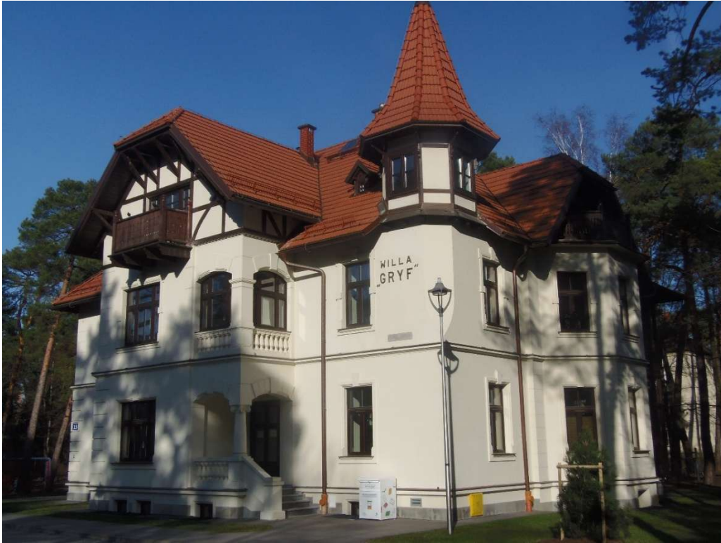
Rycina 1. Willa „Gryf”